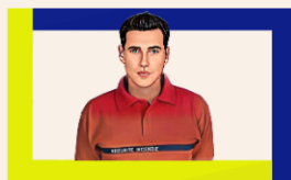
Agent de sécurité SSIAP1

Un agent SSIAP 1 (Service de Sécurité Incendie et d'Assistance à Personnes) est chargé d'assurer la sécurité incendie et l'assistance aux personnes dans les bâtiments publics et privés. Son rôle principal consiste à prévenir les incendies, à surveiller les systèmes de sécurité incendie, à organiser des évacuations et à apporter une assistance lors des situations d'urgence.