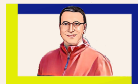
Agent de sécurité SSIAP3