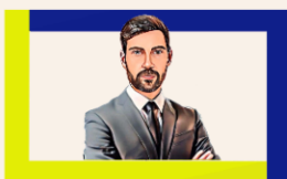
Agent de sécurité SSIAP2

Le chef de service sécurité incendie (SSIAP 3) assure la prévention et la sécurité incendie dans les établissements recevant du public (ERP) et les immeubles de grande hauteur (IGH) Il manage et encadre le personnel affecté au site et conseille le chef d'établissement en matière de sécurité incendie. Il réalise le suivi des obligations de contrôle et d'entretien.